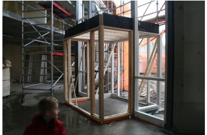
Het portaal van de school in ruwbouw klaar