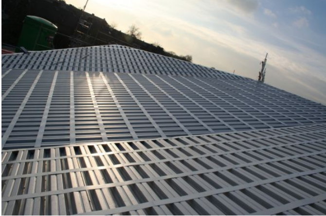
Het kanaaldak... vanaf de steiger, mooie ritmiek ☺