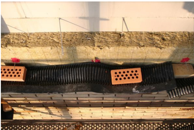
Zicht van boven op een deelgemetselde muur. Duidelijk zichtbaar zijn van achter naar voor: